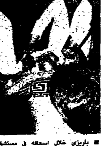
باريزي خلال اسفله في مستشفى باليمو، قبيل مفارقه الحياة

الانوار في لبنان: ٦٠٠ ليل في بيروت: ٨٠٠ ليل في طرابلس: ٧٠٠ ليل في صور: ٦٠٠ ليل في النبطية: ٦٠٠ ليل في زحلة: ٦٠٠ ليل في البعلبعل: ٦٠٠ ليل في طبريا: ٦٠٠ ليل في حاصبيا: ٦٠٠ ليل في راشيا: ٦٠٠ ليل في الكسروانية: ٦٠٠ ليل في عكا: ٦٠٠ ليل في حيفا: ٦٠٠ ليل في الناصرة: ٦٠٠ ليل